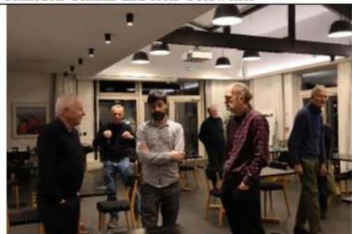
Nach dem Spiel beim gemeinsamen Analysieren